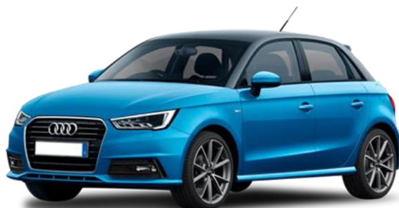
AUDI A1 SPB 25 TFSI S TRONIC ADMIRED