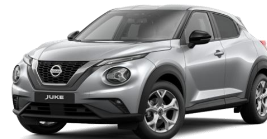
NISSAN JUKE 1.0 DIG-T 114 CV DCT N-CONNECTA