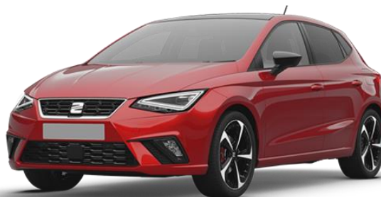
SEAT IBIZA 1.0 TGI 5 PORTE BUSINESS